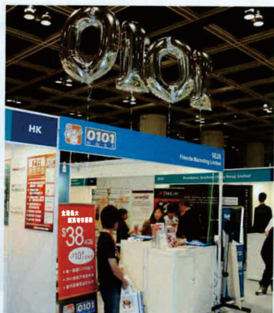
0101host擁有多項自行研發的功能，方便客戶使用。該公司於今年資訊科技展中推廣其服務。